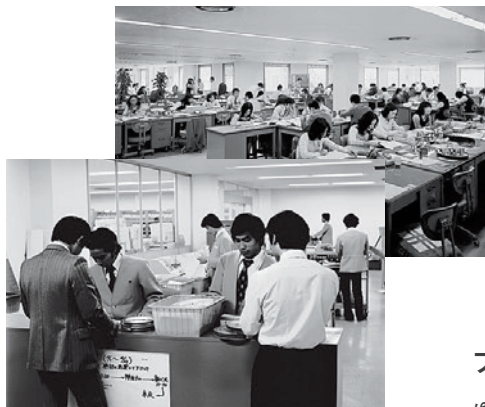
経営再建の中、給与水準アップと男女格差是正が労使交渉の重要課題に

SDI(全国一般用医薬品パネル調査)がスタートし、女性調査員の採用を展開。「調査を通じた社会参加」を動機に応募した女性も